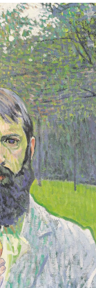
CUNO AMIET Dall'alto a sinistra: La raccolta delle mele, 1907, olio su tela, 100x100,5 cm.; Paradiso, 1958, olio su tela, 192x182 cm.; Autoritratto con mezza, 1901, olio su tela, 64,5x54 cm.

tica e con il quale Amiet espose nel 1953 a Olten in una mostra di grande successo. E tra i tanti meriti dell'esposizione vi è anche l'attenzione per l'opera grafica dell'artista svizzero esplorata attraverso una sessantina di opere su carta (schizzi, bozzetti, cartoline, disegni, manifesti, silografie, litografie, acquaforti e acquerelli) che ci restituiscono la vena più giocosa e ironica, fino ai limiti della satira, di un uomo che seppe essere sempre anche divertito e divertente e che ponendo la natura (come quella che trovava nel suo personale giardino/paradiso di Oschwald) in dialogo continuo con l'umano come il luogo in cui (ri)nuotare la felicità e gli stimoli per guardare con positività al futuro.